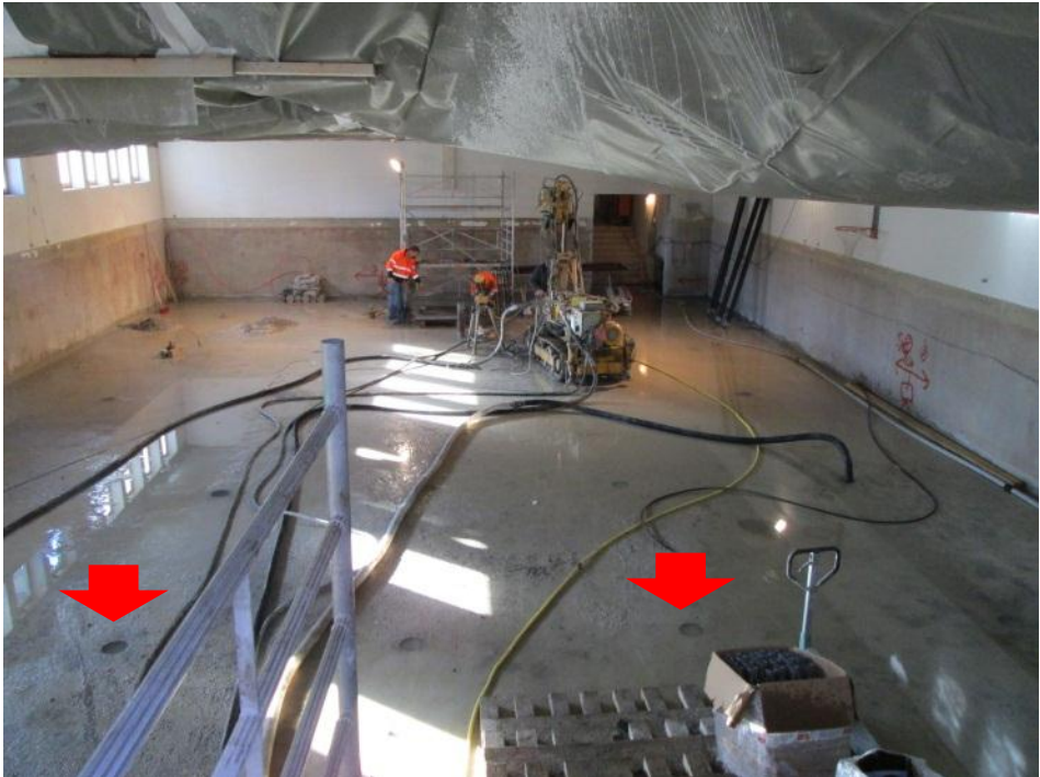
Spülbohren für Anker

Zur Zeit wird auf die bestehende Bodenplatte 30 cm aufbetoniert. Diese Arbeiten werden bis Mitte Dezember abgeschlossen.