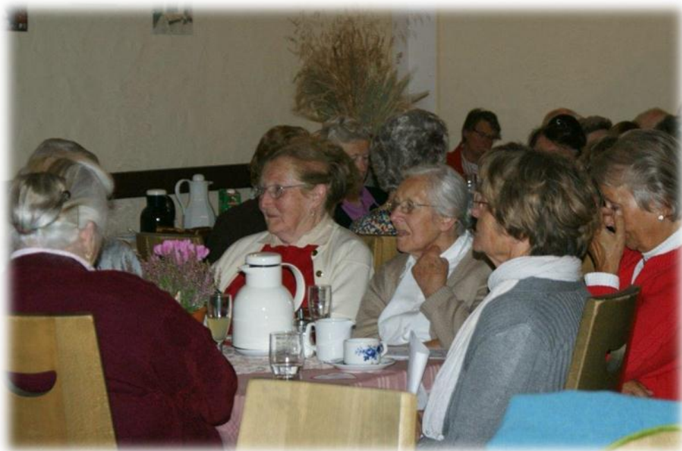
Gemütliches Zusammensitzen beim Seniorennachmittag